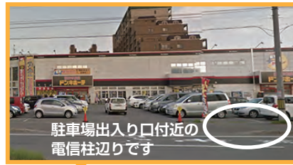
駐車場出入り口付近の電柱辺りです