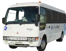
▲無料送迎バス (乗車定員 29名)