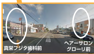
真栄フジタ歯科前 ヘアサロン グローリ前