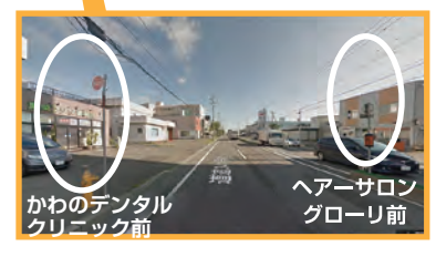
かわのデンタル クリニック前