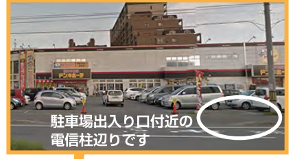
駐車場出入り口付近の 電信柱辺りです