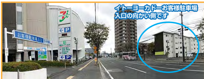
イトーヨーカドーお客様駐車場入口の向かい側です